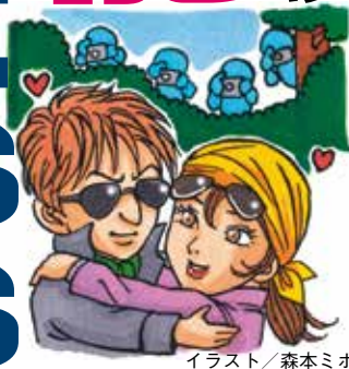
イラスト/森本ミホ